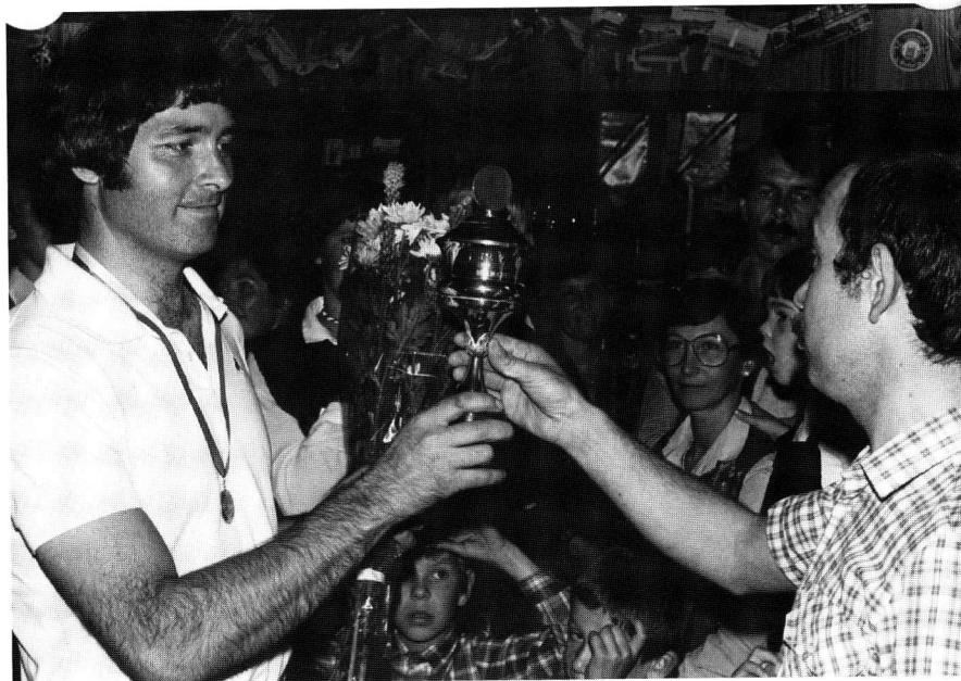
Clubkampioenschap jaren tachtig.

“Soms wel, soms niet. Ik heb me wel eens zorgen gemaakt om bepaalde ontwikkelingen. Aanvankelijk waren er twee groepen, A en B. Maar sommige jongens die op B-niveau fietsten, wilden per se bij A horen en gingen forceren om dat te bereiken. Inmiddels zijn er 5 à 6 groepen en ik zie dat nog steeds gebeuren. Volgens mij staat dat haaks op het doel om gezond sportief bezig te zijn.